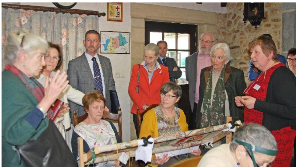
8 Bezoek Koningin PAOLA op 26 maart 2019 aan "Het Tapijt van Assenede"