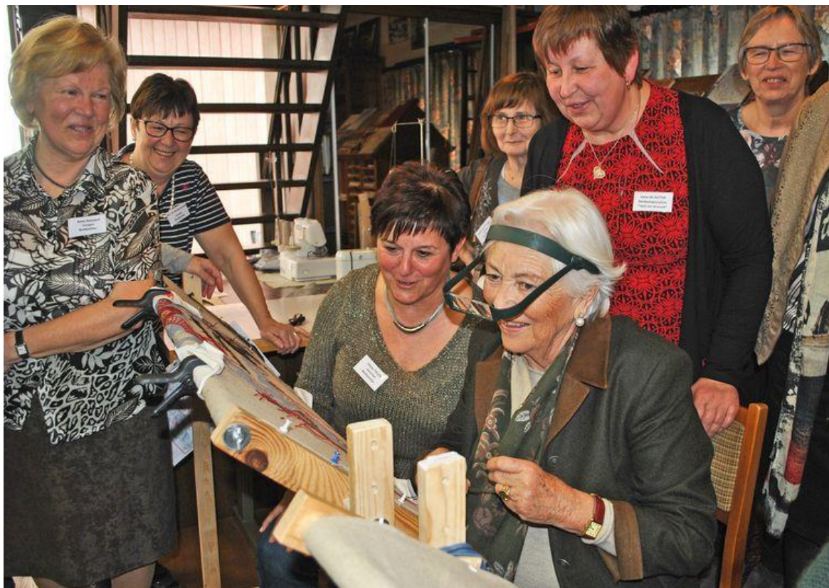
JSA Koningin Paola probeerde zelfs even mee te borduren.

HLN.be, Joeri Seymortier, 27 maart 2019, 09u34 (Digitale krant HET LAATSTE NIEUWS)