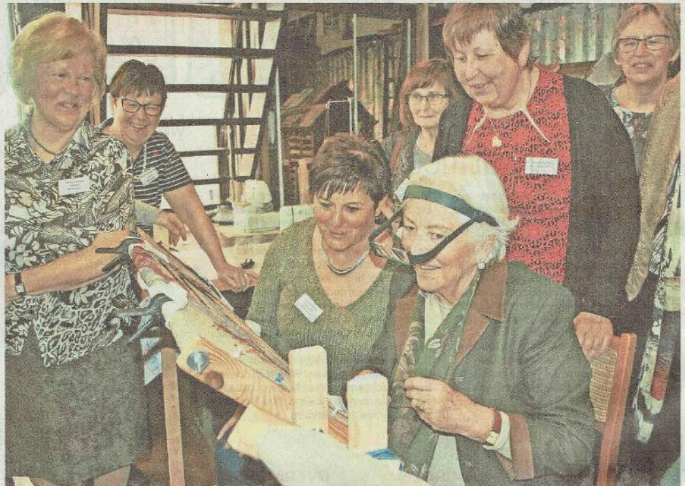
Koningin Paola ging zelf even aan de slag en probeerde een stukje tapijt te borduren.

«Het hoge gezelschap heeft veel vragen gesteld, en heeft alle vrijwilligers uitge-