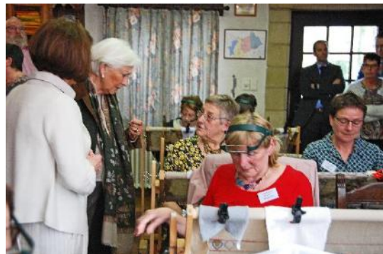
9 Bezoek Koningin PAOLA op 26 maart 2019 aan "Het Tapijt van Assenede"