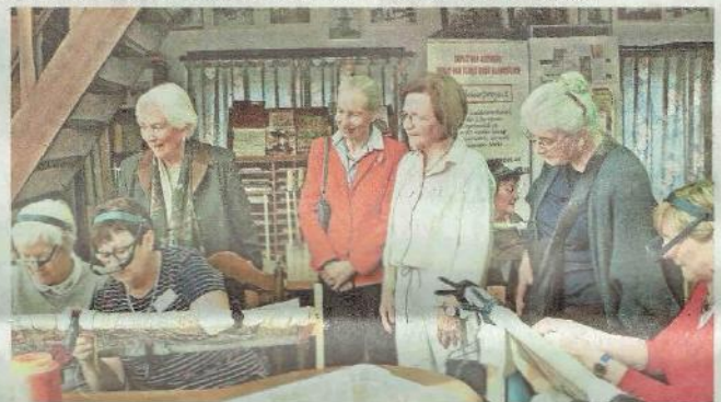
Maar liefst 81 borduursters zijn aan de slag om het tapijt van 100 meter te maken.

Nu al zijn 50 van de 90 geborduurde doeken klaar. Ter gelegenheid van de Erfgoeddag zullen die op 28 april eenmalig tentoongesteld worden in het Karmelklooster in de Burgstraat in Gent.