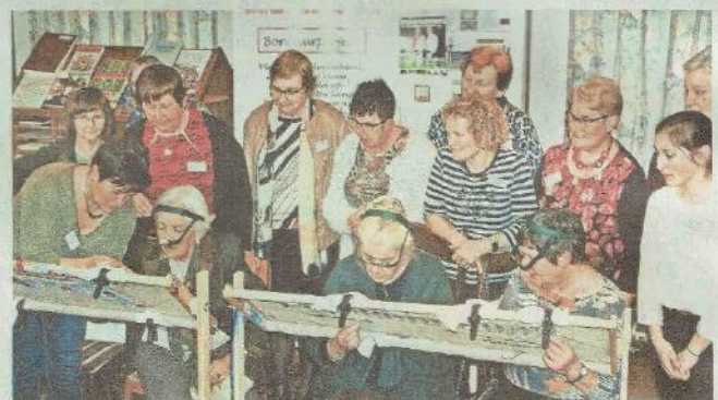
Koninklijk bezoek op 't Holleken. Links onderaan zie je koningin Paola aan de slag.