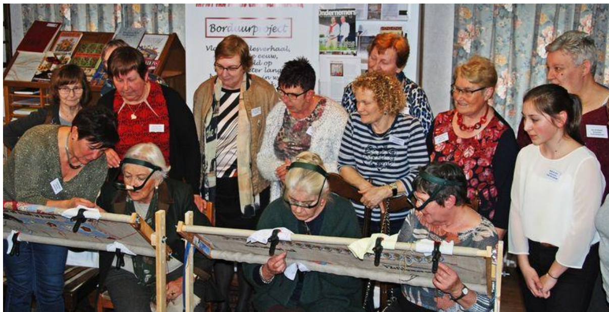
JSA Koninklijk bezoek op 't Holleken. Links onderaan zie je koningin Paola aan de slag.