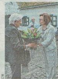
De Belgische koningin en de Poolse gravin amuseerden zich duidelijk.