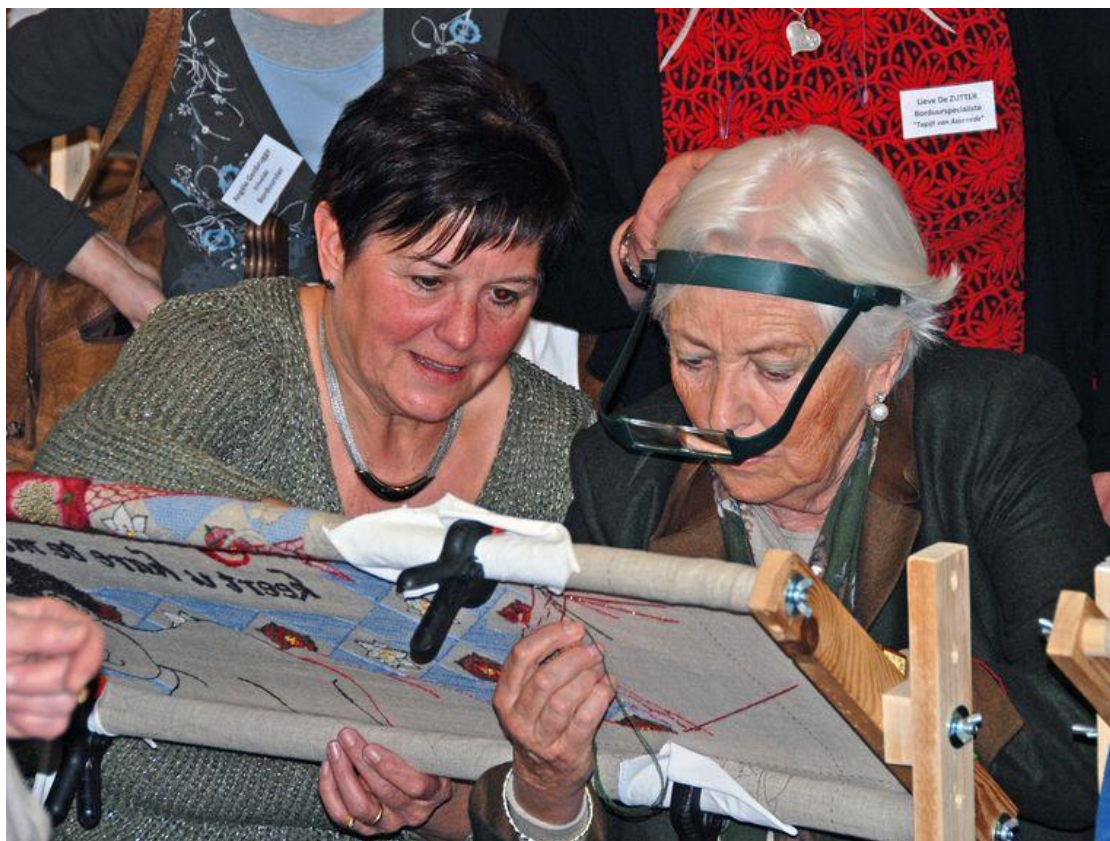
JSA De koningin werkte bijzonder geconcentreerd.